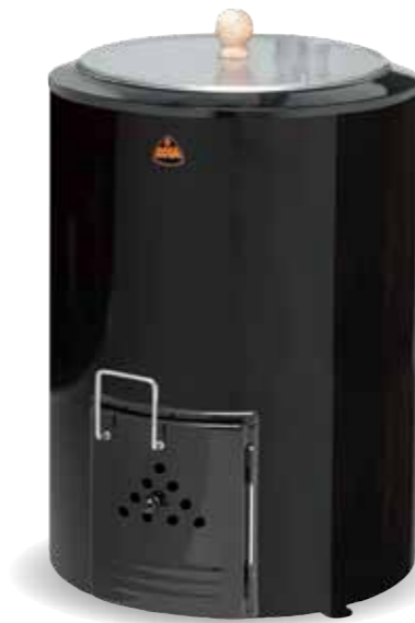
Kota 80 l