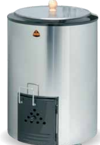
Kota 50 l rst