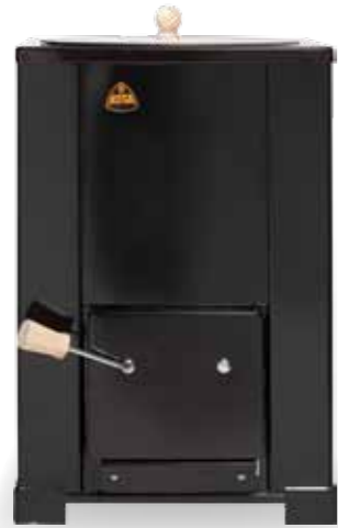
Kota 50 l